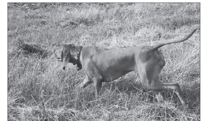
ASHLEY z Weitovho lomu vystavuje.