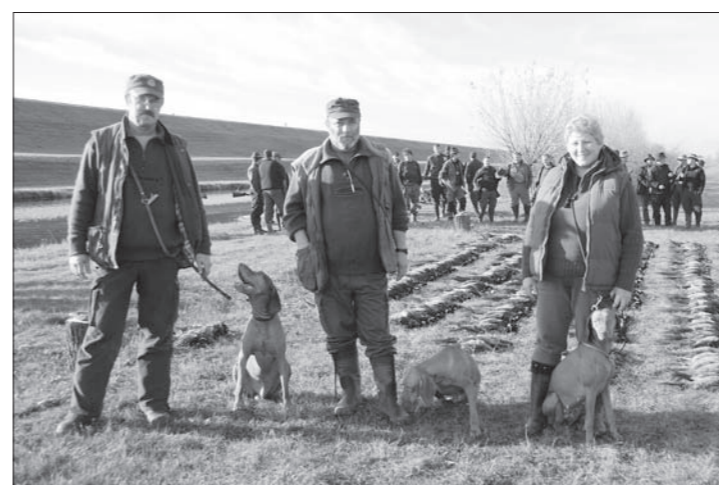
Vyžly patria na poľovačkách vždy k najväčším „pracantom“.