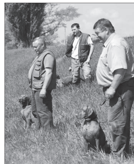
Na inštruktáži v Topolníkoch.

2713 S HVIEZDA Gábor Klem, Bródy Sándor ut. 8, H-7100 Szekszárd Dátum vývozu: 4. 11. 2009