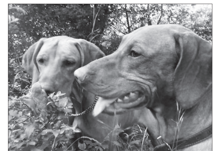
A ty vtáčik, čo tu robíš? (D'Hunter z Vodného mlyna & Co)