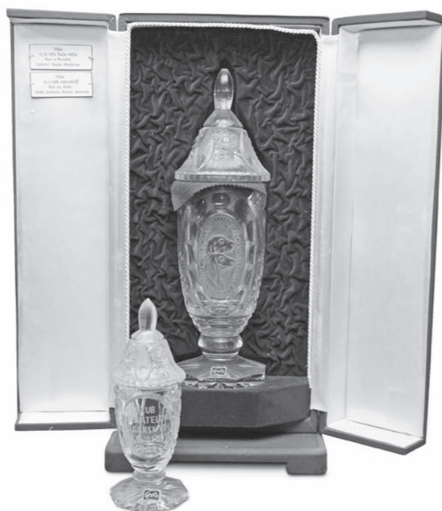
Tak o takýto pohár sa súťažilo na skúškach, ktoré boli predchodcom Memoriálu Alexandra Mészárosa..