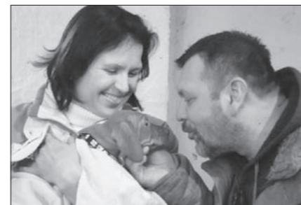
Aira v náručí nových majiteľov.