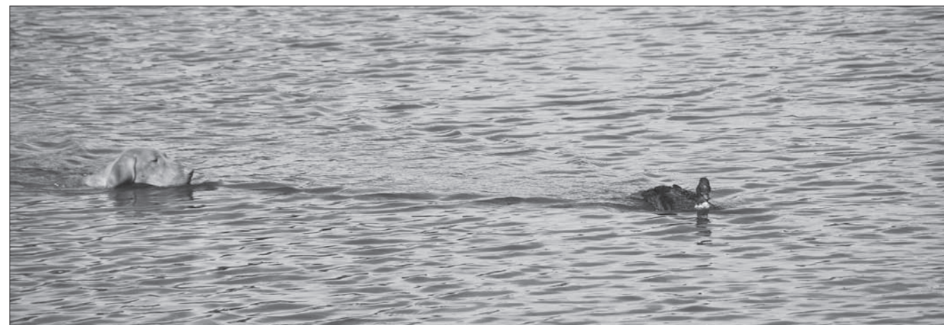
ASHLEY z Weitovho lomu – 2. miesto na Chovných skúškach.