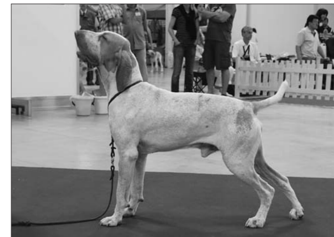
Klub zastřešuje i plemeno Bracco Italiano.

15551 CH Zöldmáli ÍRISZ, MET Dszmv 3573, 15. 5. 2006 O: Hejőcsabai DICSOSEG; M: Zöldmáli ALMA Chov.+ Maj.: Zsófia Miczek, HU výborný 1, CAC, CACIB, Svetový víťaz