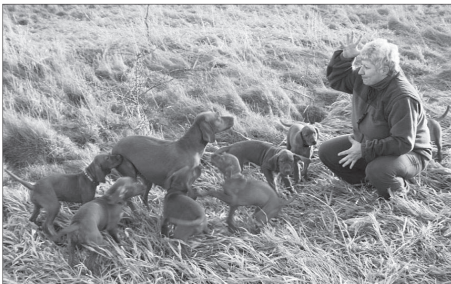
Celá „banda“ pohromade.

Prvý fešák bol psík a mal 400 gramov a 17 centimetrov. Bol to skutočne ohromný zážitok aký sme nikdy predtým s Matkom nezažili. Boli sme šťastní a Asiu sme celú dobu chválili a povzbudzovali, a seba po každom šteniatku tiež (slivkou) aby sme to aj my mali ľahšie. Asia rodila pohodovo a každú hodinu a pol prišlo na svet šteniatko, nakoniec ich bolo 7 statočných – 4 suky a 3 psíci. Radosť a nadšenie nám každý