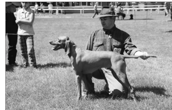
DONA Sidin dvor – Klubový víťaz 2009 – suky (zo psov sa stal klubovým víťazom KRIS Malomközi).