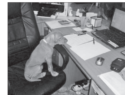
Dúfam len, že toto sa nebudem musieť učiť...