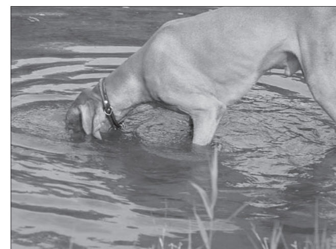
Tak kačička, kde si sa schovala? (ALAN Sidin dvor)