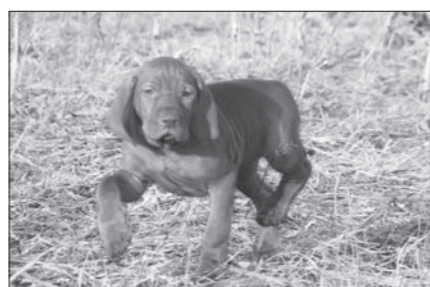
Amysko na skusoch.

V pelechu začalo byť živo, lebo šteniatka objavili čaro tackania a ich presuny nám často vyrážali dych. Ani sme sa nenazdali a dubáci behali, bolo ich treba prikrmovať a pelech sa stal malým a tak sme sa presťahovali do klubovne (bývalá sušiareň), kde v priestore 6 krát 7 m mali vytvorený ideálny priestor na šantenie. Klubovňa s mini barom sa