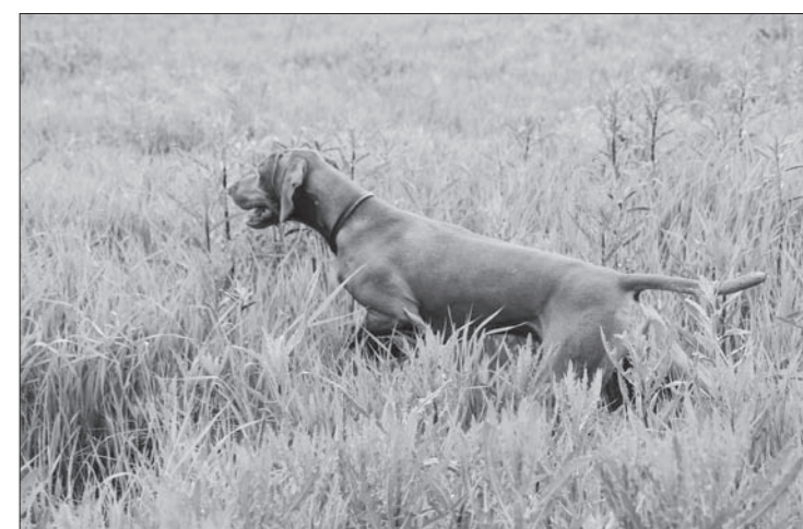
Keď je zver, je to vždy radosť...