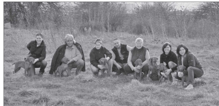
Jedno z mnohých stretnutí...

Som jedno zo šteniatok, z chovateľskej stanici z Karpatských lúk o ktorých je písané v predchádzajúcom príspevku.